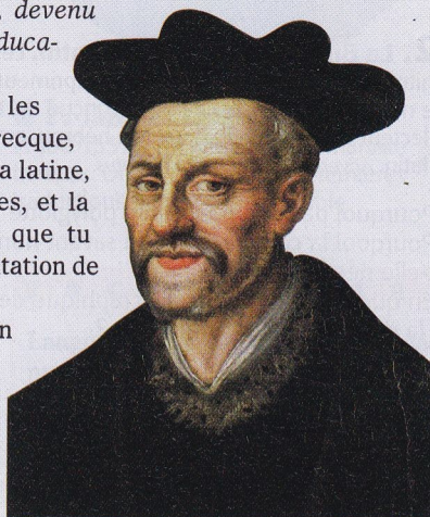
François Rabelais (1494-1553)

Mais parce que selon le sage Salomon, sagesse [sagesse] n'entre point en âme malivole [malveillante] et science sans conscience n'est que ruine de l'âme , il te convient de servir, aimer et craindre Dieu, et en lui mettre toutes tes pensées, et tout ton espoir.